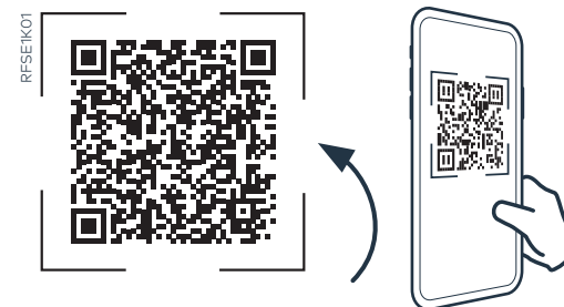
Dein QR-Code | hier scannen